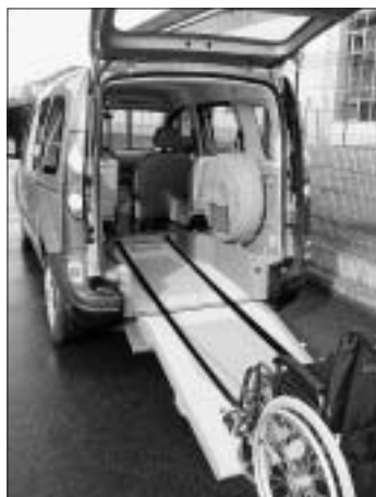
Avec « Ted », le client peut tester le véhicule.

Ted permet aux clients de tester le véhicule conçu pour eux avant de se décider à l'acheter.