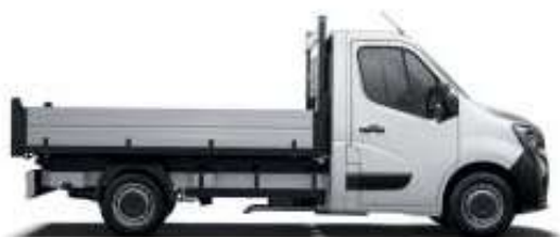
Benne basculante arrière

Nouveau Renault MASTER se décline en de nombreuses versions dont la benne basculante arrière. Les châssis ou planchers sont idéaux pour les transformations les plus variées.